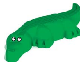
Och kanske en krokodil gömmer sig i skogen?