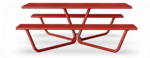
Bänkbord för både små och stora