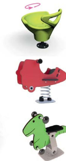
Små snurr-, fjäder- och vippungor.