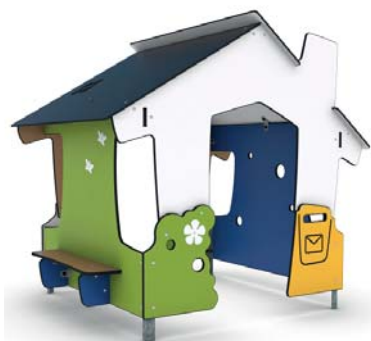
I skogskanten, vid fikaplatsen finns ett litet hus där man kan inta sin matsäck.