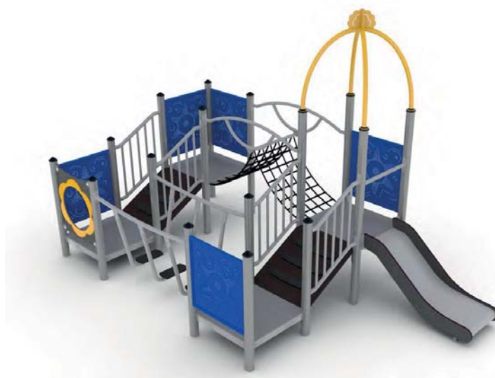
En liten lekställning för lagom utmaning för de minsta med bland annat en 60 cm hög rutschkana.