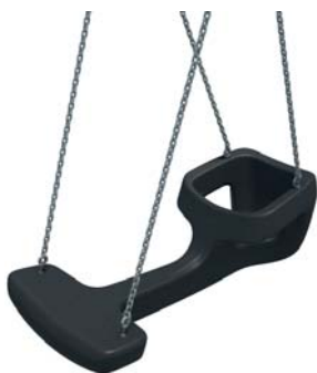
Gunställning med en två vanliga gungsitsar och en likt ovan med plats för ett litet barn och en vuxen.

Vid sittplatsen kommer det att finnas ett bänkbord för stora och ett för små. Dessutom ett litet lekhus där man kan inta sin matsäck om man vill!