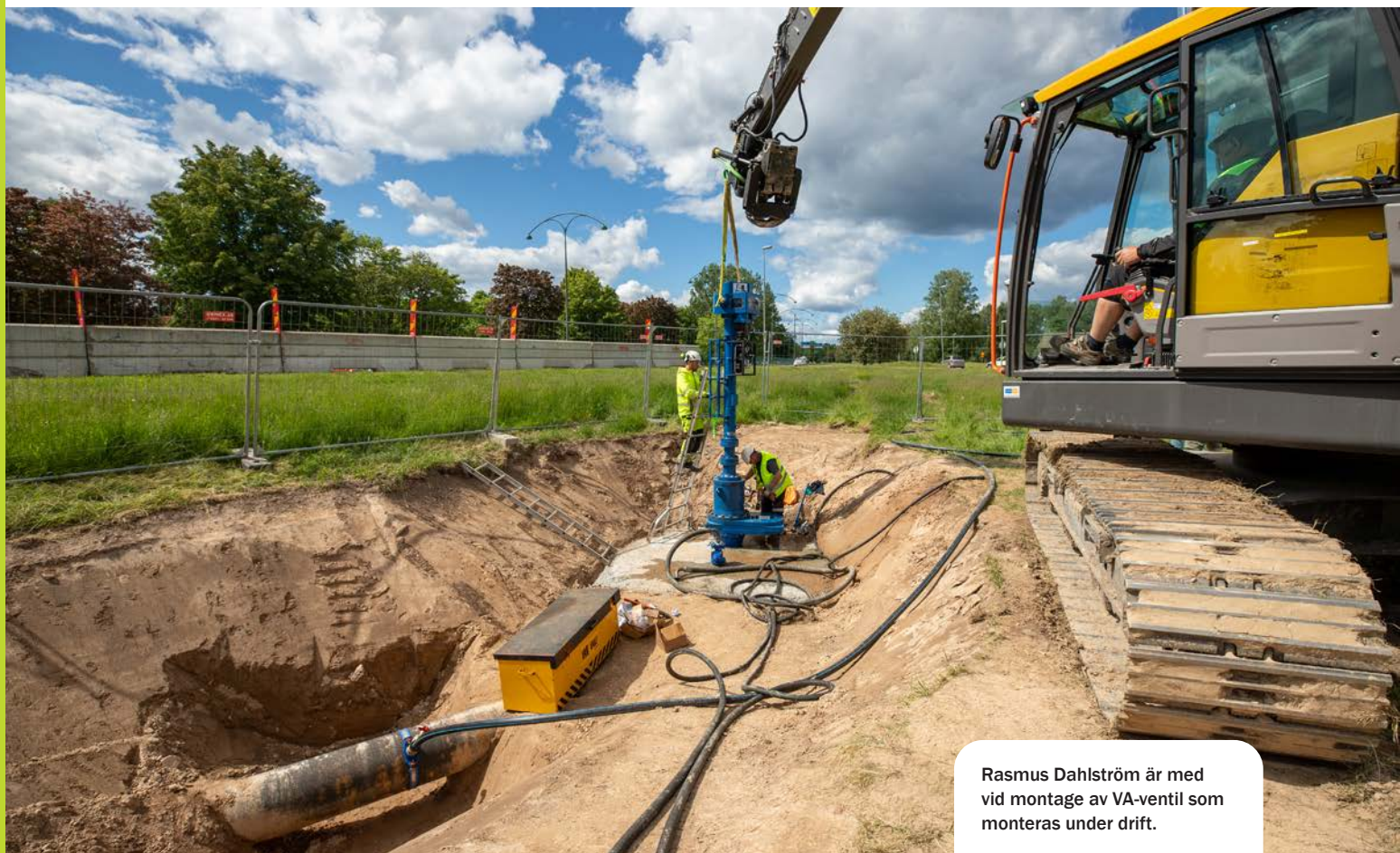
Rasmus Dahlström är med vid montage av VA-ventil som monteras under drift.

Resultat efter finansiella poster i procent av justerat genomsnittligt eget kapital (eget kapital och obeskattade reserver med avdrag för uppskjuten skatt).