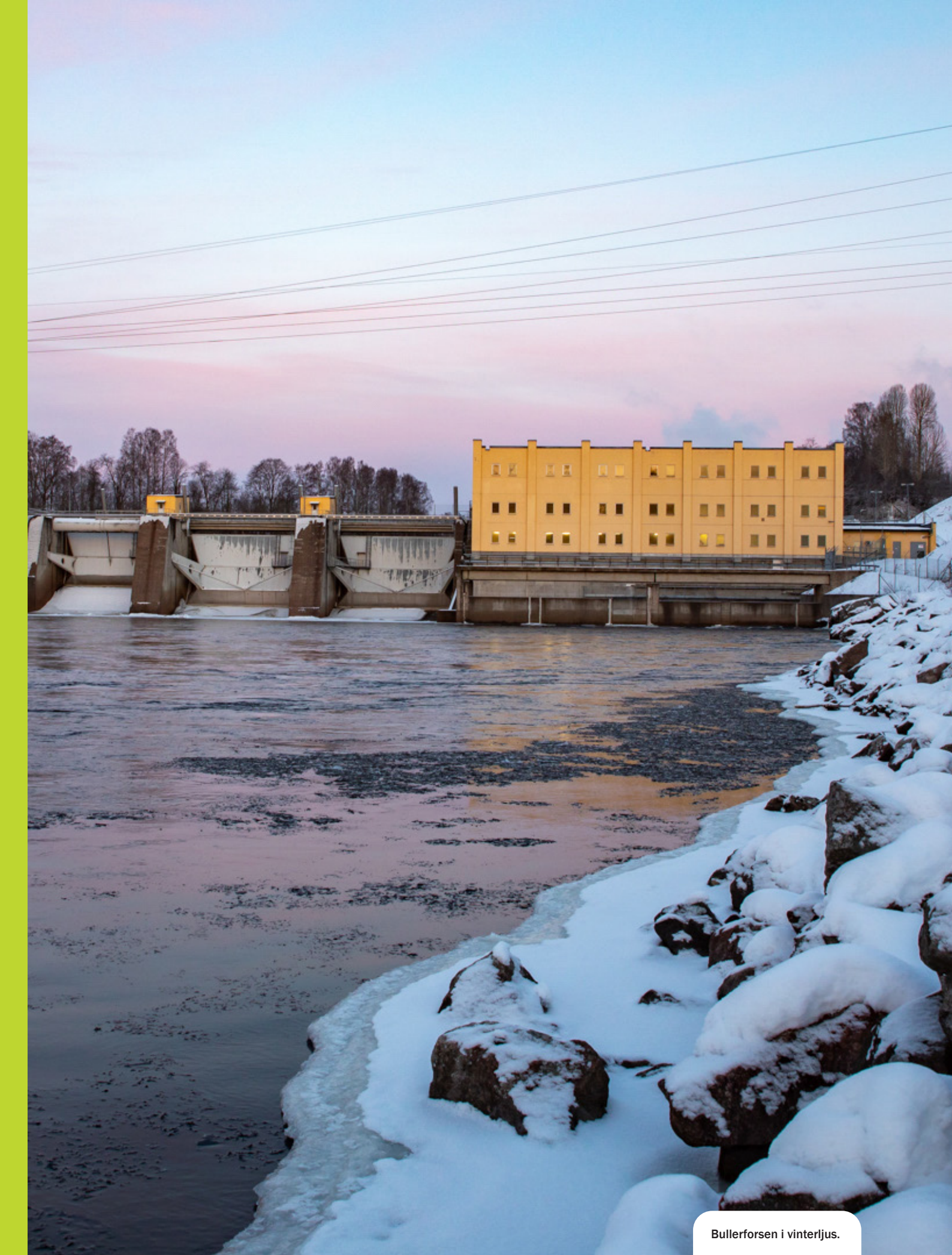
Bullerforsen i vinterljus.